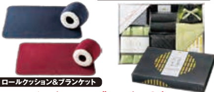
ロールクッション&ブランケット

「ロールクッション&ブランケット」もしくは「竹炭生活 部屋中まるごと8点セット」