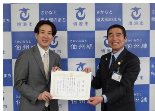
境港市役所での感謝状贈呈式