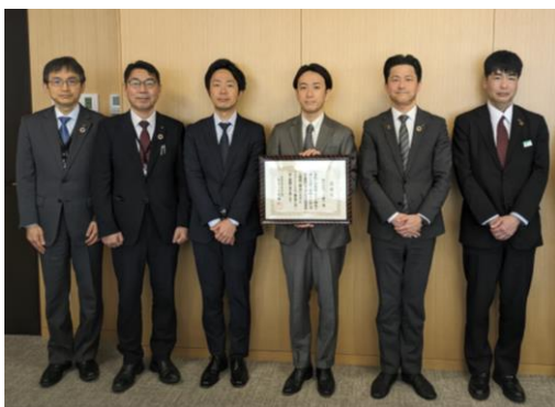
松江市役所での感謝状贈呈式